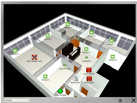
Fig. 3: Software CMS