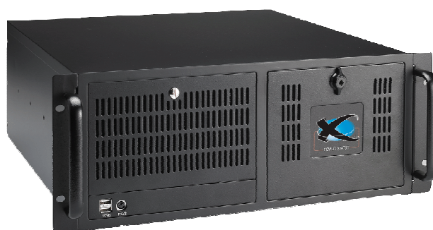
Fig. 2: CMS 4