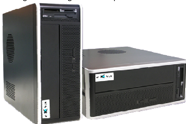
Fig. 1: CMS 1 e CMS 2

Com o CMS o seu utilizador acederá a cada um dos videogravadores existentes na sua rede. O modo de funcionamento é simples e rápido. Do lado esquerdo do ecrã existe uma listagem de todos os videogravadores conectados ao CMS. Seleccionado o HVR ou NVR pretendido poderá visualizar em tempo real as imagens das câmaras conectadas assim como configurar o sistema e visualizar as gravações. Com este sistema poderá, ainda, gerir cada espaço equipado com os videogravadores através das funcionalidades de gestão edifícios. Controlo da iluminação, acessos, AVAC e alarmes são algumas das mais-valias que as soluções de videovigilância inteligente EXVA apresentam nacional e internacionalmente.